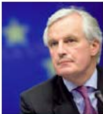
Michel Barnier, Ministre de l'agriculture et de la pêche

Plan d'action pour développer les circuits courts